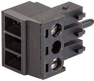
MCS 19 Anschlussklemme

Siehe unten: Zulassungen und Konformitäten